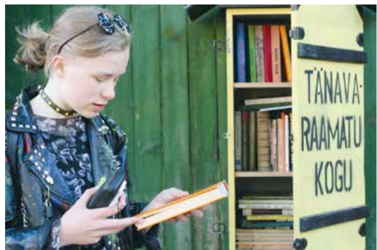
Fotovõistlusel 3. koha pälvinud töö.

Jälgige lugemisühingu tegemisi meie kodulehel www.lugemisyhing.ee ja Facebook'is ning leidke oma huvidele ja võimalustele sobivad tegevussuundi!